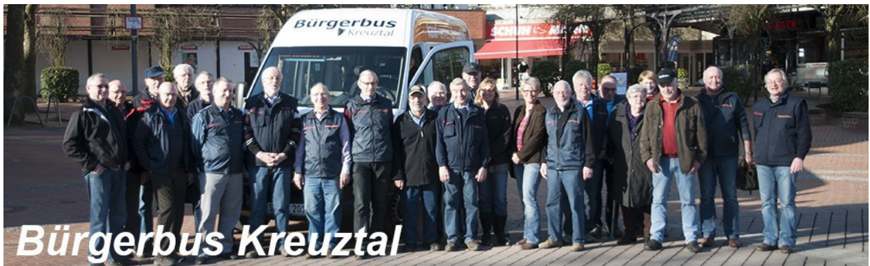
Figure 3 – Les conducteurs et le minibus

Au début (1998) il y avait 40 passagers par semaine (environ 2.000 par an). Au bout de trois ans (2001) le nombre de voyages était monté à 8.000 par an et il est actuellement de 10.000 par an. Cela représente trois passagers par voyage en moyenne. Selon une enquête réalisée il y a dix ans, près de la moitié des passagers disent prendre le minibus une fois par semaine. Il y a un plus grand nombre de passagers sur certaines lignes (Est) et à certains jours (jour de marché) mais il est rare qu'il y ait plus de huit passagers et que le conducteur doive appeler un taxi. Cela n'arrive qu'une fois par mois environ.