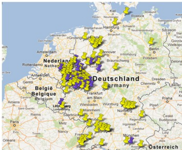
Figure 1 – Les autobus citoyens en Allemagne

Clubs existants en jaune, clubs en projet en bleu – Lien vers la Source