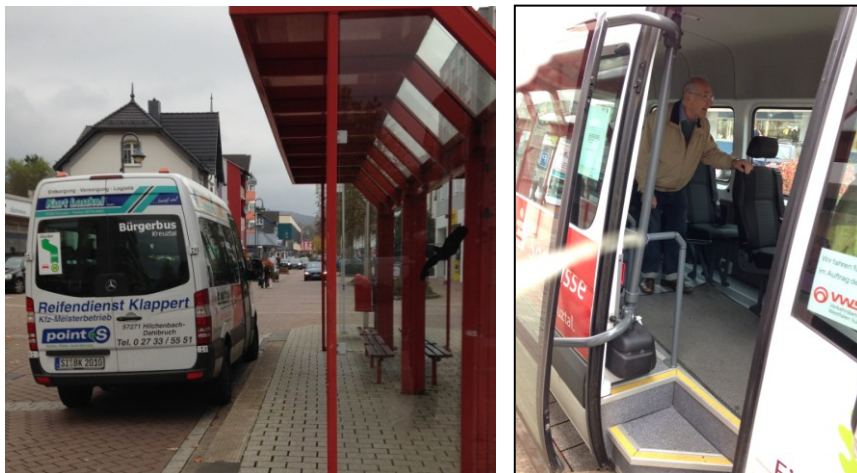
Figure 2 – Minibus, équipements et publicités

La municipalité de Kreuztal a approuvé le plan des lignes et les horaires en tant qu'autorité organisatrice des transports. Elle apporte au club une garantie financière de 5.000 € mais celle-ci n'a jamais servi.