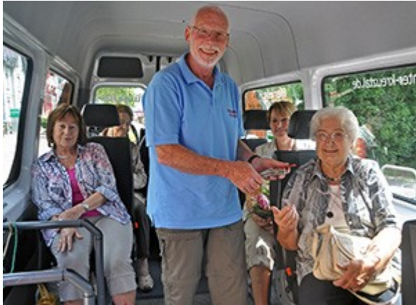
Figure 4 – Un conducteur et ses passagers

L'autobus citoyen représente un coût annuel de 21.000 € incluant l'amortissement du véhicule et le fonctionnement. Au total, ce coût est couvert par la Région RNW (57%), les passagers (33%) et la publicité (11%). Les subventions s'élèvent à 1,2 € par passager, un financement public qui est du même ordre de grandeur que celui des services de bus réguliers. Cependant il ne serait pas possible de desservir les mêmes zones résidentielles avec des grands bus conduits par des professionnels salariés.